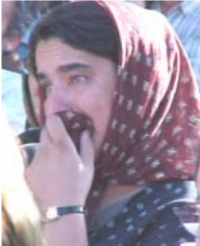
پناهنده متحصن در شمال عراق